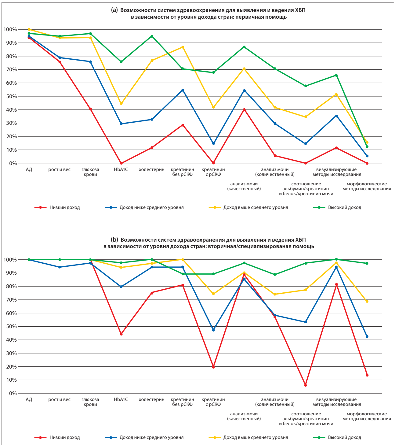
Рис. 1. Медицинские услуги по выявлению и лечению хронической болезни почек в странах в зависимости от уровня дохода

(a) Первичная медико-санитарная помощь (т.е. основные медицинские учреждения на местном уровне [например, поликлиники, диспансеры и небольшие местные больницы]).