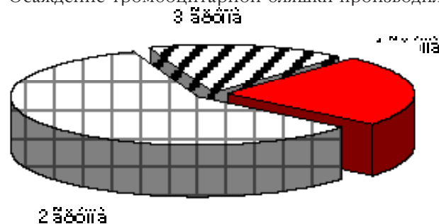
Рис. 1. Группы больных: 1 – острый пиелонефрит; 2 – хронический пиелонефрит на фоне ПМР в стадии ремиссии; 3 – острый гломерулонефрит

Центрифугированием образца при комнатной температуре (800g × 15 мин) получали обогащенную тромбоцитами плазму, используемую для осаждения клеток. Осаждение тромбоцитарной бляшки производили