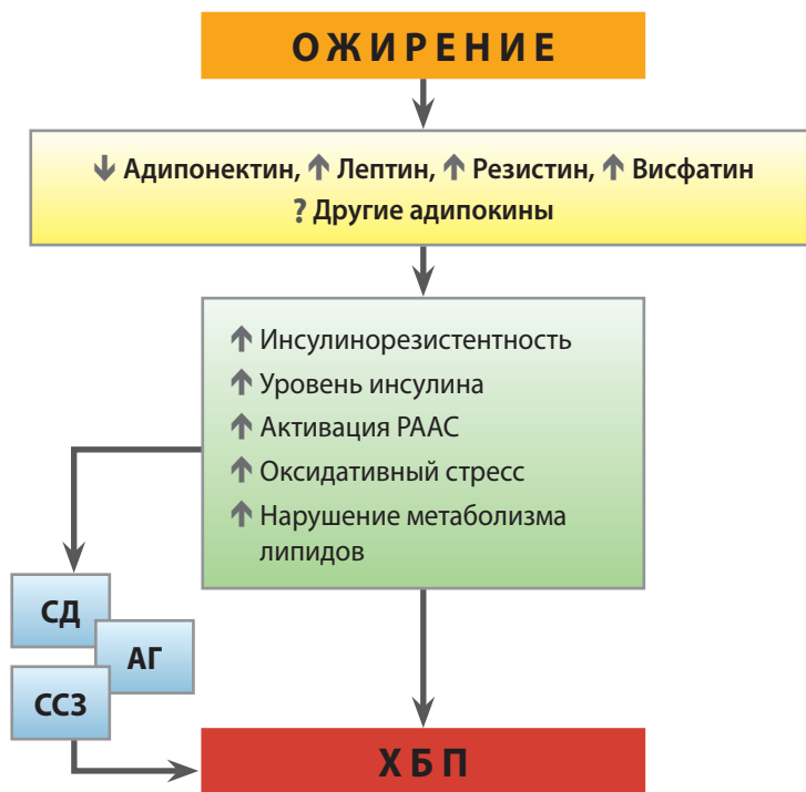
Рис. 1. Предполагаемые механизмы развития хронической болезни почек при ожирении

Механизмы, лежащие в основе увеличения риска рака почки, наблюдаемого у лиц с ожирением, изучены недостаточно. Стимулирующее влияние